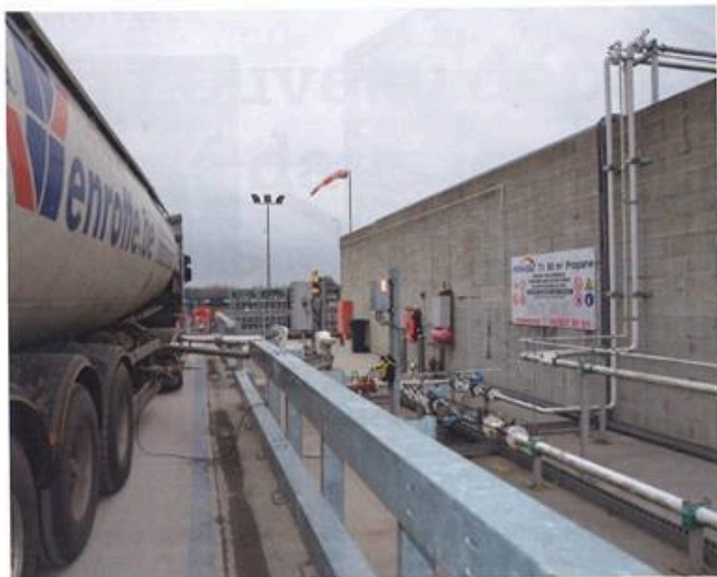
† Approvisionnement de propane en vrac.