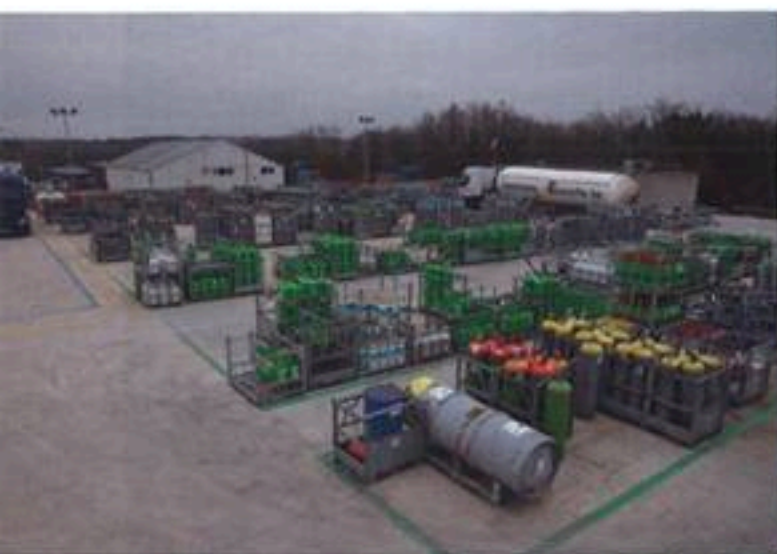
Le nouveau site de 10.000 m 2 a une capacité de stockage de quelques 10.000 bouteilles de gaz, en plus des réservoirs de 90.000 litres de propane et de 8.000 litres d'azote.

gions d'agrandir le site depuis plusieurs années déjà. Les premiers plans datent de plus de dix ans, mais c'était sans compter sur la crise économique de 2008. Par prudence, nous avons préféré attendre la sortie de la crise pour être certains de pouvoir supporter l'investissement. C'est donc en bon père de famille que Jean-Yves Henrotte a relancé ce projet dont l'investissement représentait 400.000 € en 2011. Le nouveau dépôt a fait l'objet d'une longue réflexion pour le rendre le plus pratique possible. Alors que la superficie initiale est désormais affectée exclusivement au stockage de butane et propane (de la marque Primagaz), l'extension de 6000 m 2 est dédiée aux