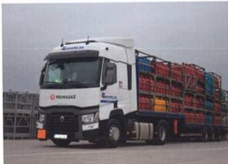
† Matériel dernier cri. Les plus observateurs auront repéré la nouvelle identité visuelle de Primogaz.