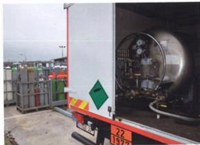
† L'entreprise Henrotte dispose également d'un camion dédié à la distribution d'azote, un gaz notamment utilisé pour la conservation et le transport de sperme de Blanc bleu belge.

permettra, mais je sais que je ne suis pas éternel et que la question se posera un jour. Cette entreprise est un peu mon bébé. J'ai commencé avec mes 10 bonbonnes de propane lorsque j'étais couvreur. Aujourd'hui, l'entreprise a bien grandi. J'ai la satisfaction d'avoir réussi quelque chose. D'autres auraient peut-être fait mieux, mais je suis content d'offrir du travail à autant de familles. Et mon premier collaborateur, engagé il y a trente ans, est toujours actif dans l'entreprise !